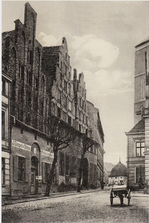
▲ Am Wendländer Schilde