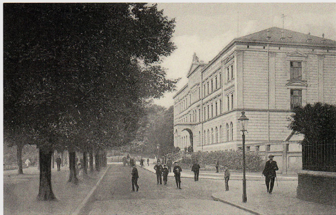
▲ Große Stadtschule – Wallstraße